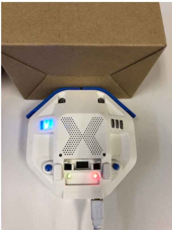
左スイッチ・右スイッチの命令一覧